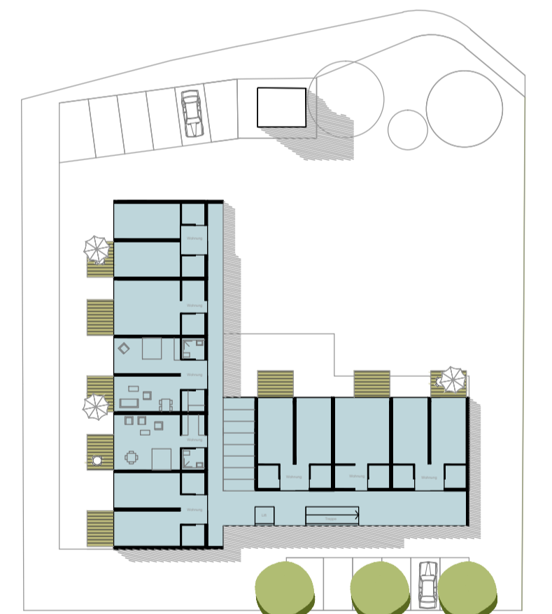
Seniorenwohnen 8 Wohnungen, 3_12WG, 5_2ZWG