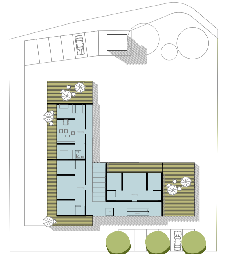
Seniorenwohnen Penthouse 3 Wohnungen, 3_3ZWG