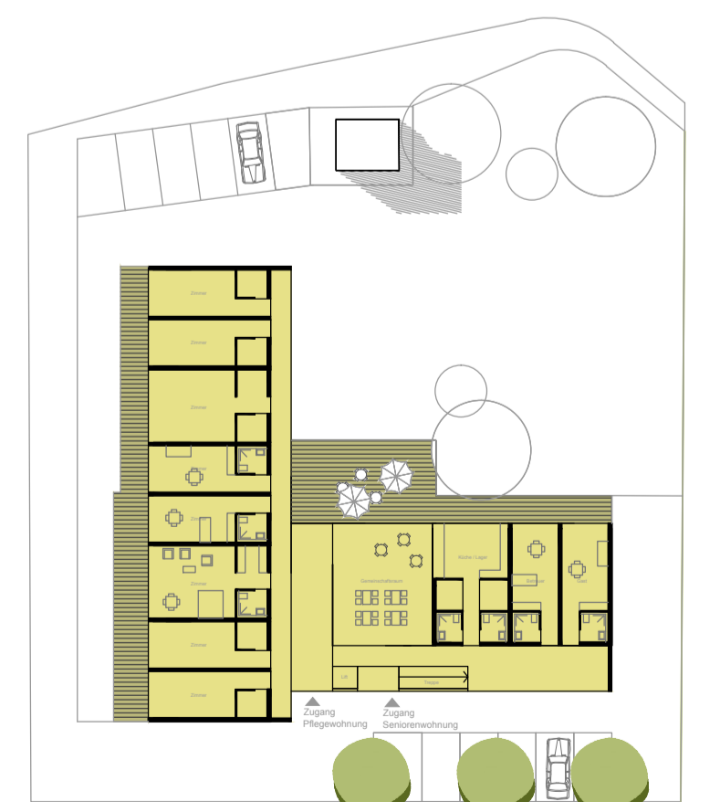
Seniorenwohnen 8 Wohnungen, 3_12WG, 5_2ZWG