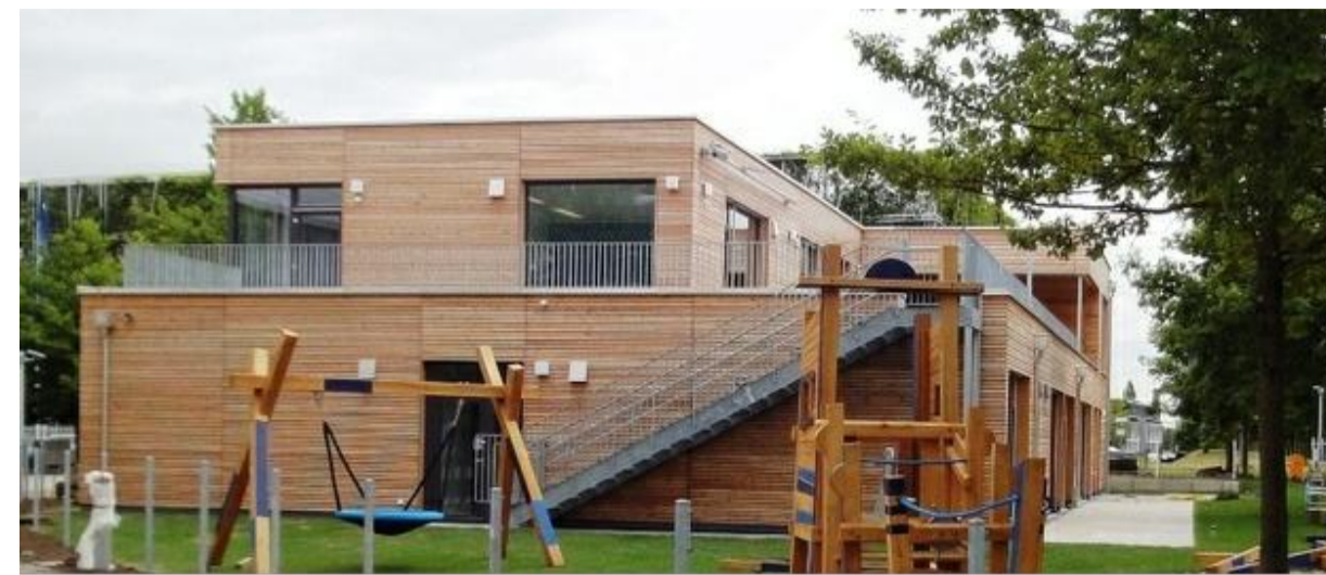
KINDERGARTEN 5-zügig + 2 Kleinkindergruppen 2-geschossig