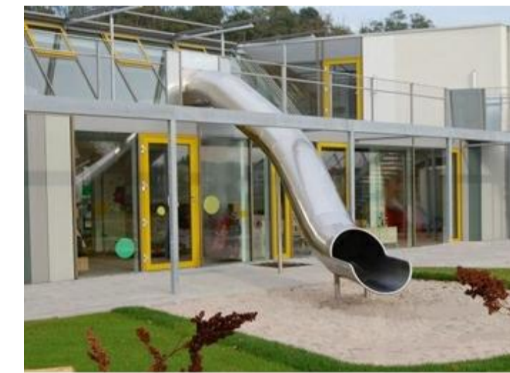
KINDERGARTENRUTSCHE Verbindung Obergeschoss - Außenbereich