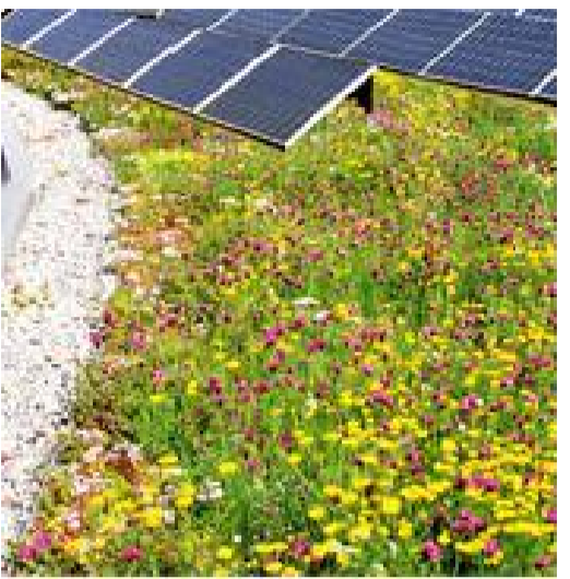
EXTENSIVE DACHBEGRÜNUNG z.B. mit Sedum oder Steinrosen