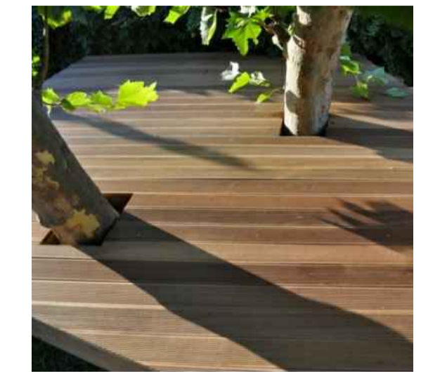
KINDERGARTEN AUSSENANLAGE. Holzsteg um bestehende Bäume