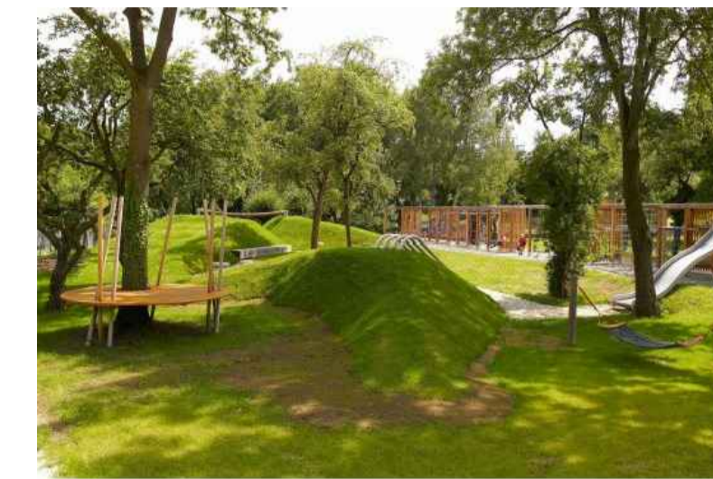
KINDERGARTEN AUSSENANLAGE. modellierte Obstwiese