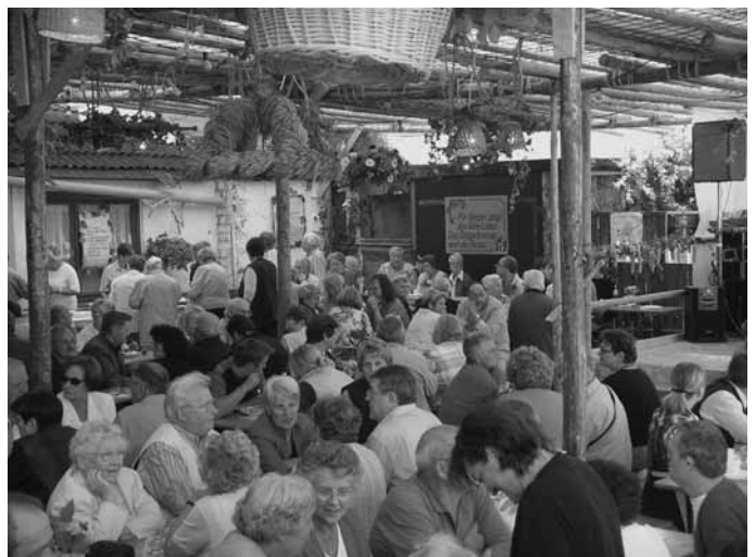
In gemütlich dekorierten Höfen, Kellern und Lauben entlang der Feststraße werden am Wochenende badische Spezialitäten und Gottenheimer Spitzenweine serviert.