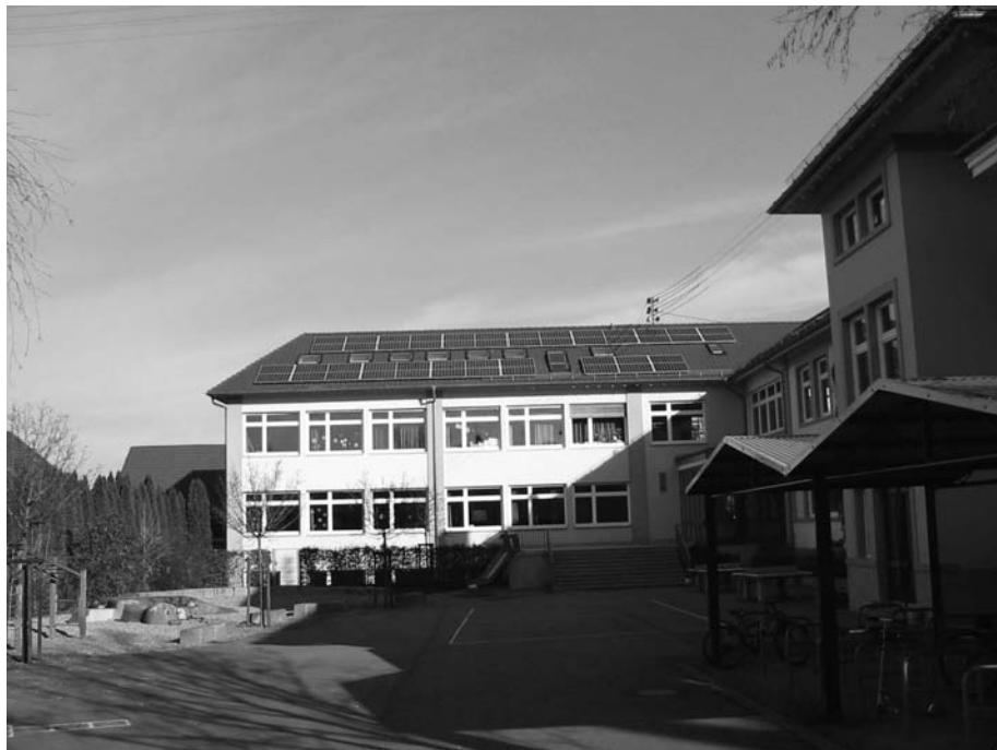
Hier sehen Sie das Dach der Grund- und Hauptschule.

Hier gibt es für Interessenten einen ausführlichen Beteiligungsprospekt.