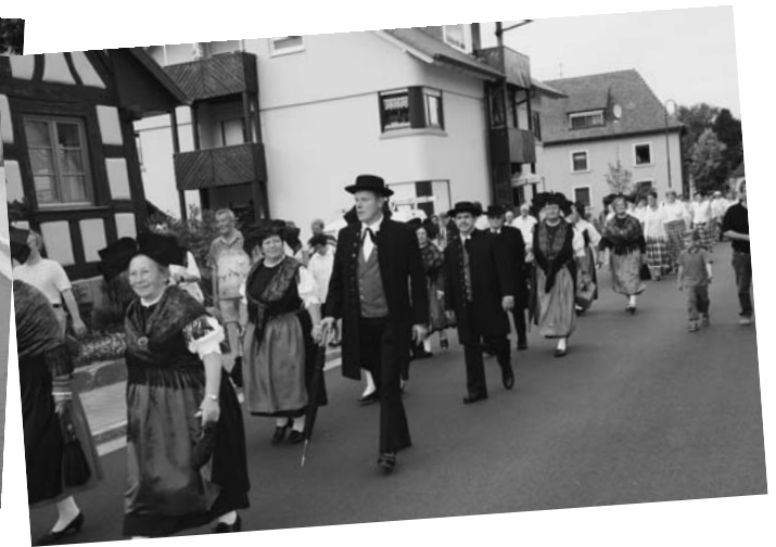
Bilder der Trachtengruppe