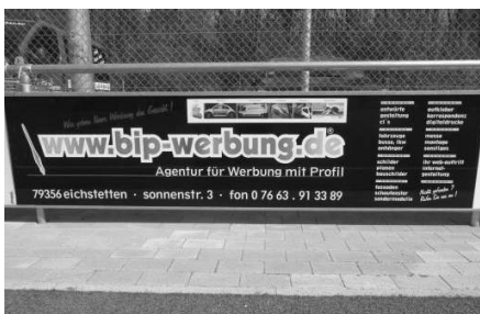
Firma BIP Werbung, Sonnenstr. 3 in 79356 Eichstetten

Die Firma BIP Werbung aus Eichstetten, Spezialist für Fahrzeug- Schilder- und Anhängerwerbung, sponsert mittels einer drei Meter Bande. Somit konnte erneut ein neuer Sponsor für den Sportverein Gottenheim gewonnen werden.