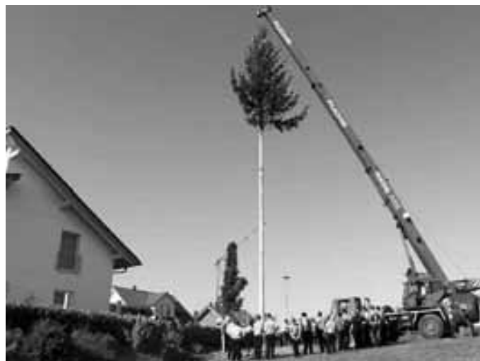
Die Freiwillige Feuerwehr Gottenheim stellte eine Bürgermeistertanne.