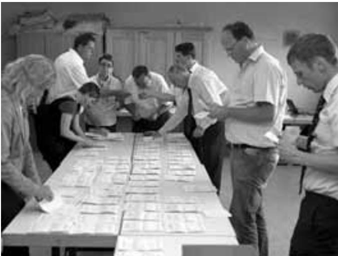
Spannend wurde es am Ende der Stimmenauszählung.