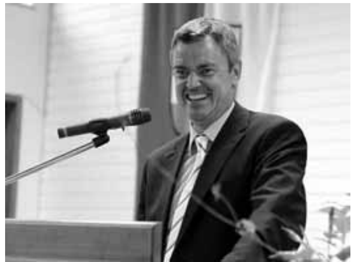
Ein glücklicher Sieger: Gottenheims Bürgermeister Volker Kieber startet in die zweite Amtszeit.