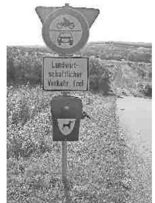
Übersichtsplan von den aufgestellten „Hundeboxen“

„Unser Dorfbild und die Landschaft auf Gottenheimer Gemarkung ist unsere Visitenkarte für Gäste aus der Region und aus der ganzen Welt. Es ist keine gute Werbung für Gottenheim, wenn die Wege und Straßen durch Hundekot verschmutzt sind“, gibt der Bürgermeister zu bedenken. Insbesondere Hundebesitzer sowie alle Bürgerinnen und Bürger sind dazu aufgefordert, weitere Standorte, an denen Hundeboxen sinnvoll sind, bei der Gemeindeverwaltung zu melden.