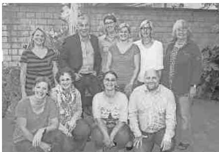
Der neue Vorstand des Fördervereins der Schule Gottenheim

Kinder – wenn die Sommerferien nicht ganz ausgebucht sind, dann gibt's noch unser Wassergeflüster am ersten Ferientag und am Donnerstag, 6. August 2015. Wir freuen uns auf Euch.