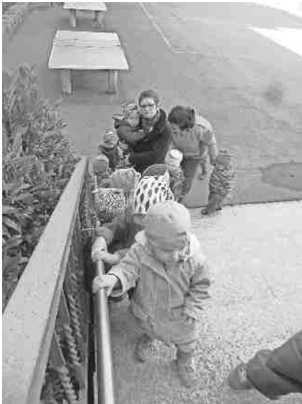
Die Kinder der Schatzinsel und Team

Die Kinder und Erzieherinnen der Schatzinsel freuen sich sehr über den Handlauf an der Steintreppe im Schulhof und den Handlauf zur Turnhalle. Die Kinder können nun sicher nach oben und unten gehen!!! Herzlichen Dank an die Gemeindeverwaltung und den Gemeindevorstand