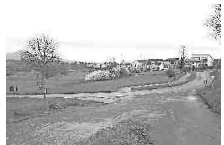
Ein Acker am Rande des Gewerbegebietes Nägeelsee und das Grundstück an der Riedkurve sind aus Sicht der Gemeinde die einzigen Flächen, die für den Bau einer Flüchtlingsunterkunft des Landkreises geeignet sind.