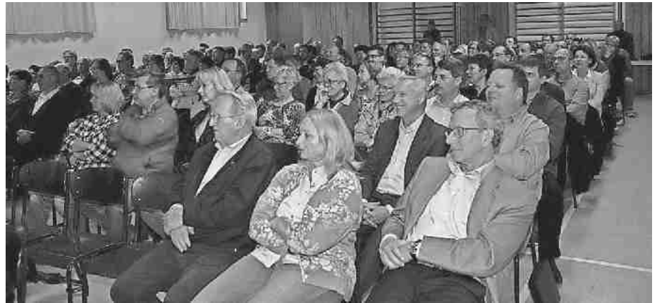
Viele Bürgerinnen und Bürger interessierten sich für die Informationen des Landkreises und der Gemeinde zur Flüchtlingssituation im Kreis und in Gottenheim.