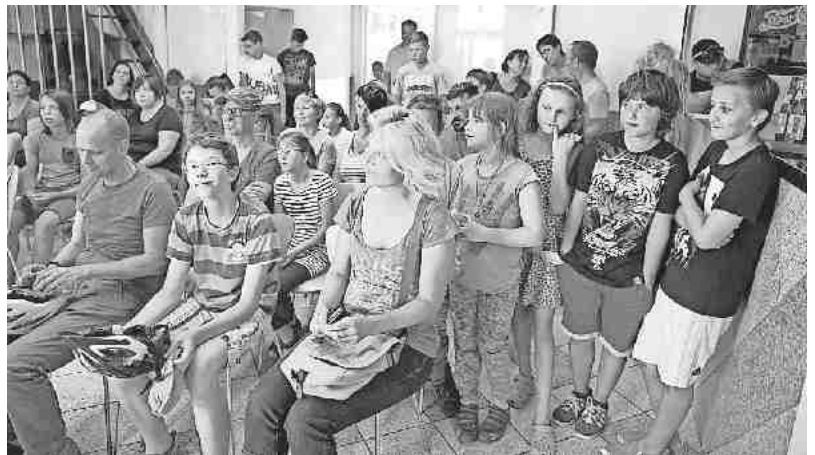
Der Andrang war groß bei der Vorstellung des Sommerferienprogramms im Jugendhaus in Gottenheim am Samstag, 16. Juli.

Weitere Anmeldungen zu den Angeboten des Gottenheimer Sommerferienprogramms nimmt der Jugendclub am Dienstag, 26. Juli, von 19 Uhr bis 20 Uhr, im Jugendhaus entgegen. Die Programmhefte mit allen Angeboten wurden in alle Haushalte in Gottenheim verteilt. Weitere Programmhefte liegen in der Bäckerei Zängerle und im Rathaus in Gottenheim aus und können dort abgeholt werden. Die Anmeldemodalitäten sind im Programmheft erklärt. Das Programm ist auch im Internet unter www.gottenheim.de zum Download bereitgestellt.