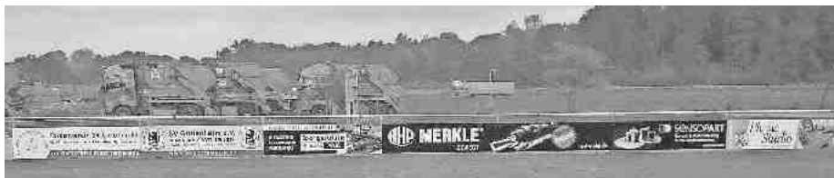
die neuen Sportbanden am Rasenspielfeld des SV Gottenheim