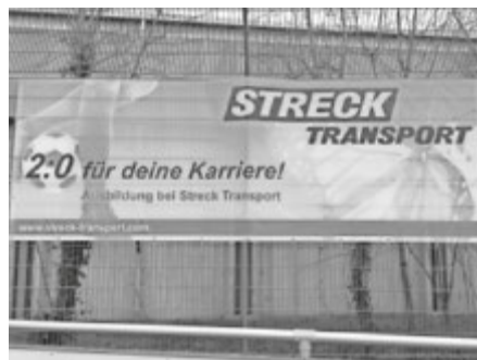
Foto: der neue Werbebanner der Firma Streck Transportgesellschaft

Die Firma Streck Transportgesellschaft mbH aus FR-Hochdorf ist neuer Sponsor des SV Gottenheim