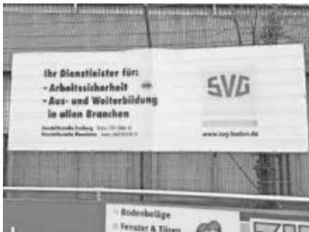
Der neue Werbebanner der Firma SVG Baden, Weißerlstr.9 in 79108 Freiburg Hochdorf

Die Firma SVG Baden eG (Straßenverkehrs-Genossenschaft) aus Freiburg-Hochdorf (Gewerbegebiet) erweitert Ihr Sponsoring um ein großes Werbebanner