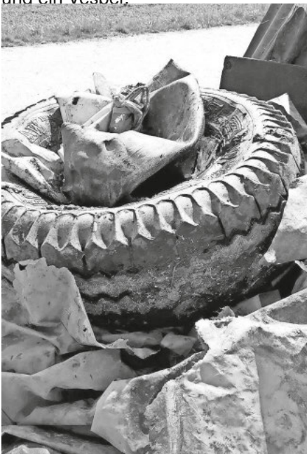
Müll von den Bächen

Dazu möchten wir die Bevölkerung recht herzlich einladen. Wir wollen gemeinsam mit den freiwilligen Helfern die Bäche sowie die Ufer ablaufen und den Müll einsammeln. Anschließend gibt es mit allen Helfern ein gemütliches zusammensitzen und ein Vesper.