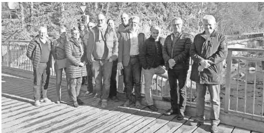
Bei der Besichtigungsfahrt des Gemeinderates im Rahmen der Klausurtagung entstand dieses Gruppenbild mit Bürgermeister.

Die Gemeinde hat im Zuge der Erweiterung des Gewerbegebiets „Nägelsee“ (unter anderem für die Erweiterung des Industriebetriebs AHP Merkle) ein sogenanntes Sondergebiet „Tourismus und Gastronomie“ ausgewiesen. Vorbild für die Ausweisung des Sondergebietes war das Projekt der Marktscheune, wie sie in Berghaupten in der Ortenau umgesetzt wurde. In Gottenheim können sich der Gemeinderat und der Bürgermeister ein ähnliches Konzept zur Stärkung von Gastronomie und Tourismus im Dorf vorstellen. Um sich über mögliche Konzepte zu informieren, war der Gemeinderat nun am Wochenende in der Region unter-