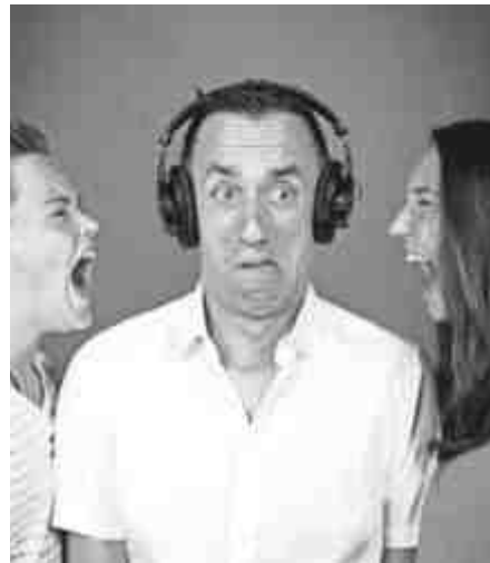
Karten zum Vorverkaufspreis für alle Veranstaltungen in der Gottenheimer