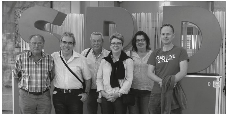
Die Gottenheimer Reisegruppe vor der Veranstaltungshalle

Darüber sollen im Oktober die Mitglieder abstimmen. Die Kandidaten für den Posten touren derzeit durch die Republik um sich persönlich vorzustellen. Am Samstag, den 14.10.2019