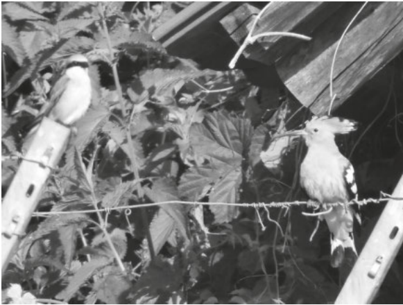
Neuntöter (l) und Wiedehopf (r) im Zwiesgespräch: über Nahrungsmangel?

Insektensterben – 2019 ein Problem, auch für den Wiedehopf am Tuniberg