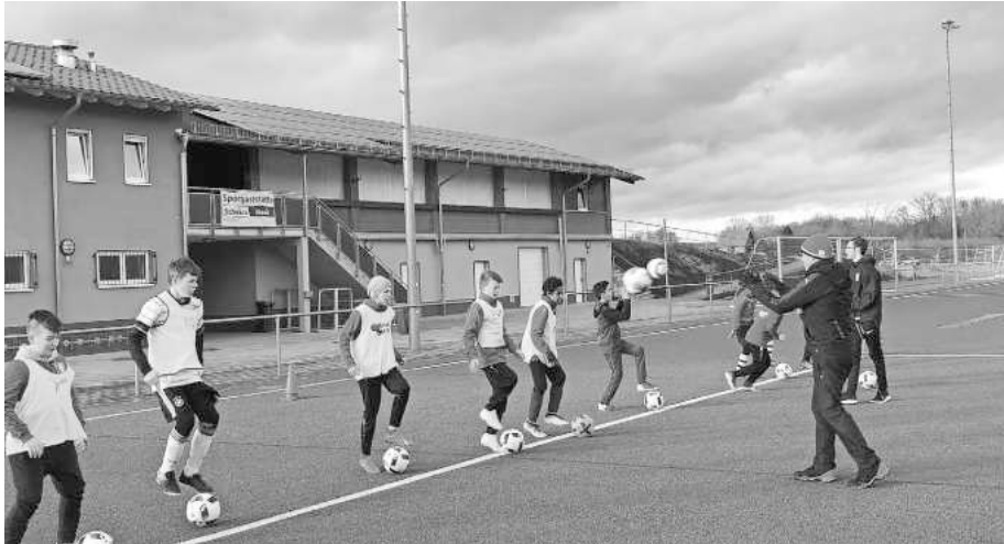
Unsere D-Junioren beim Fördertraining

Einheit und konnten eine Menge vom erfahrenen Übungsleiter mitnehmen.