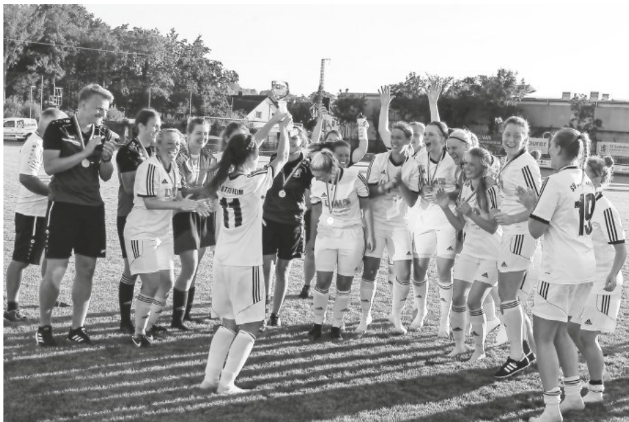
Da ist das Ding

Tore: 1:0 Werz (3'), 1:1 Gallus (10'), 2:1 Werz (39'), 2:2 Gallus (54'), 3:2 R. Gottschling (60'), 3:3 Fischer (81'), 4:3 Werz (85'), 5:3 Werz (88') / SR: Lukas Stiepermann