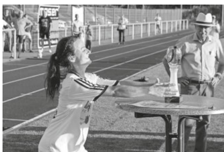
Kapitänin mit Pokal