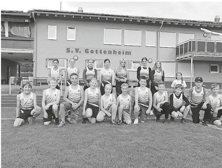
Die Kinder und Jugendlichen präsentieren ihr neues Wettkampfoutfit

Künftig kann sich Dank des Sponsorings des FÖDERVEREINES unsere Leichtathletikabteilung bei Wettkämpfen in einem einheitlichen Outfit präsentieren. Die Kosten für 32 Trikotleinchen wurden übernommen.