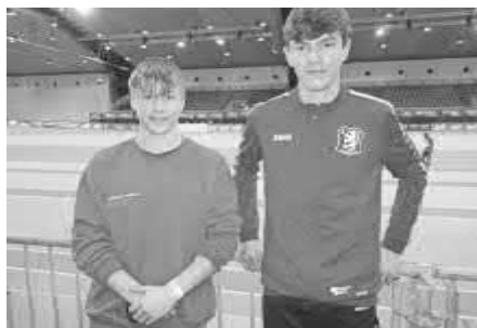
Glückliche SVG-Athleten mit neuen Bestleistungen in der Karlsruher Messehalle.

in der U18 auch die 200m aus und lief im Tartan-Oval in 24,24s auf einen starken 4. Patz.