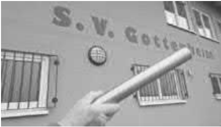
Gottenheim im Zeichen des Staffelstabs.

verzauberten. Vielen Dank für das tolle Engagement allen AthletInnen und HelferInnen bei unserem Tag im Zeichen des Staffelstabs!