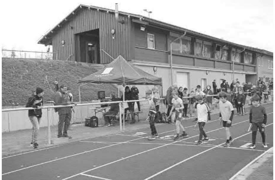
Startschuss zur 3x800m Staffel der Schüler U14.