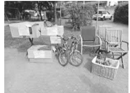
Verschenk-Tag Gottenheim 2022

standen reger Austausch über die zu verschenkenden Gegenstände und viele nette Gespräche. So war der 22. Mai ein Erfolg für Nachhaltigkeit und für die Dorfgemeinschaft. Auch im nächsten Jahr wird voraussichtlich wieder ein Verschenk-Tag stattfinden. Herzlichen Dank an alle die mitgemacht haben!!