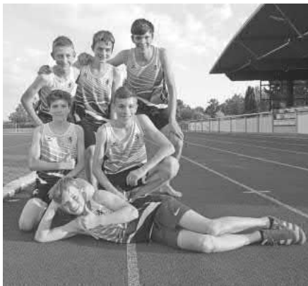
Die erfolgreiche BSMM-Mannschaft der StG Gottenheim-Eichstetten in Schutterwald