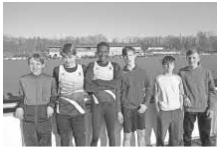
Die beiden erfolgreichen U16 3x1000m Staffeln der StG Gottenheim-Eichstetten

Insgesamt war es ein gut besuchter und sehr stimmungsvoller Heim-Wettkampf in unserem schönen Leichtathletik-Stadion an der Buchheimer Straße. Der gut besuchte Kaffee- und Kuchen-Stand brachte neben leiblichem Wohl für die BesucherInnen und AthletInnen auch gute Einnahmen in die Leichtathletik-Jugendkasse. Vielen Dank an alle HelferInnen!