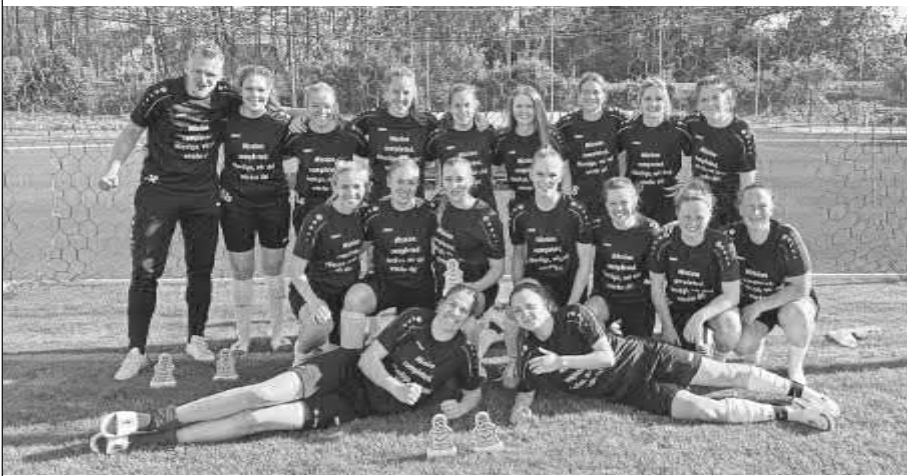
Die Meistermannschaft freut sich auf das Pokalfinale am Pfingstmontag um 15 Uhr.

Verbandsligameister und Pokalsieger, bei diesem Thema erinnern sich die Gottenheimer an die Saison 2020, da holten sich die Schwarz-Weißen beide Titel. Das SVG-Team ist überzeugt, das Double erneut zu schaffen – auf eigenem Rasen und mit den Fans im Rücken.