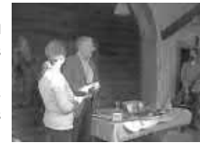
Fotos: Von der Saat zum Brot, von der Knospe zur Frucht ... / Tannenzapfen als Symbole für eine biblische Dankgeschichte / Gottesdienst vor dem Scheunentor und ein Grußwort vom Bürgermeister