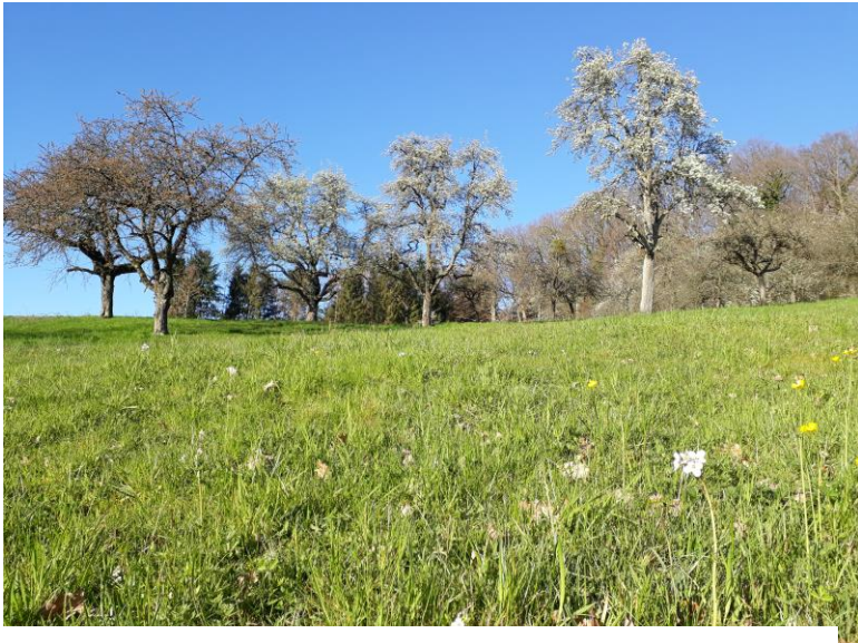
Eine extensiv bewirtschaftete Streuobstwiese mit hohen Bäumen und viel besonnter Wiesenfläche ist ökologisch sehr wertvoll.

Für den Naturschutz sind Hochstamm-Obstbäume (1,60 - 1,80 m) und geringe Baumdichten wichtig. Meist werden 50 bis maximal 70 Bäume/ha als naturschutzfachlich hochwertige Streuobstwiesen anerkannt, der Höchstwert liegt bei maximal 100 Bäumen/ha gemäß