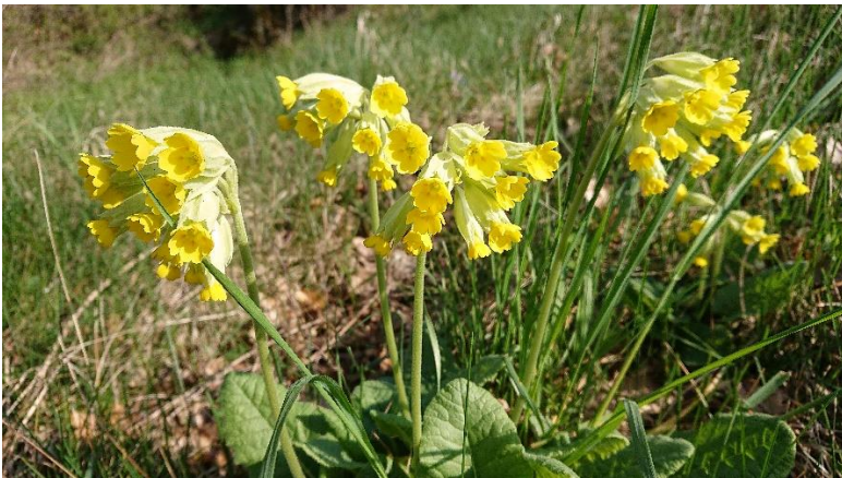
Echte Schlüsselblumen (Primula veris) brauchen regelmäßige Mahd und nährstoffarme Bedingungen (R. Treiber)

Die Wiesen sind am artenreichsten und von höchster Qualität bezüglich der Blütenvielfalt, wenn diese nicht zu stark beschattet und gemäht sind (vgl. INFO 4). Andererseits schützen Obstbäume die Flächen vor intensiver Nutzung, sodass anliegende besonnte Wiesenflächen meist nicht durch die Ausbringung von Dünger oder Silageschnitt intensiviert wurden. Hierdurch sind sie meist artenreicher als viele durchschnittlich bewirtschaftete Flächen.