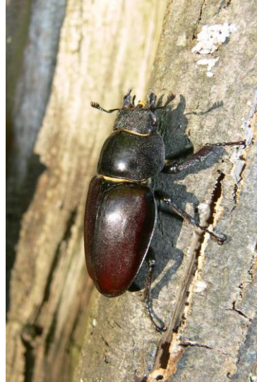
Weiblicher Hirschkäfer auf Obstbaum. Die Larven können sich in Apfelbäumen entwickeln

Streuobstwiesen gelten als wichtige Lebensräume für Tiere und Pflanzen und sind besonders erhaltenswert und schutzwürdig. Es handelt sich um ein intensiv durch den Menschen geprägtes und sehr betreuungs-intensives Biotop, das wichtiger Teil unserer Kulturlandschaft ist. Dabei hängt deren Qualität für die Natur maßgeblich davon ab, wie Streuobstwiesen eingerichtet und gepflegt werden. Ursprünglich gab es große Streuobstgürtel um die Dörfer, die aber mittlerweile