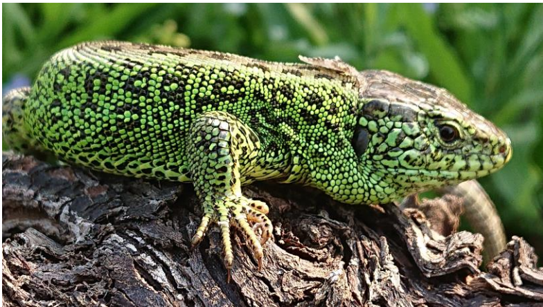
Zauneidechse auf Totholz (R. Treiber)

Um die Zauneidechse ( Lacerta agilis ) zu fördern gilt es, Strukturen zu schaffen und besonnte Grassäume zu belassen. Kleine Holz- und Reisighaufen an sonnenbegünstigten Orten sind hier sehr wertvoll. Für das Vorkommen der Zauneidechse ist es besonders wichtig, dass der Baumbestand nicht zu dicht steht. Größere Freiflächen, welche von Süden und Westen beschienen werden, sind essentiell. Altgrasstreifen als Säume innerhalb der Wiese sind sehr wichtige Schutz- und Rückzugsräume für