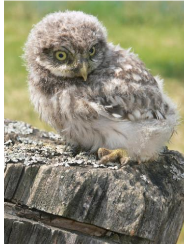
Ein junger Steinkauz in einem kleinen Streuobstbestand (R. Treiber)

Regionale Sorten spiegeln die lange Kulturgeschichte der Streuobstwiesen wider. Bei Neuanlagen sollte die Sortenwahl daher möglichst regional erfolgen. Die Auswahl hat jedoch naturschutzfachlich keine Bedeutung, denn die Obstbäume besuchenden Wildbienen sind nicht auf diese Sorten spezialisiert (sogenannte polyektische Arten). Auch für die Vogelarten sind Bäume ohne Unterscheidung von Sorten eine wichtige Habitatstruktur. Viele Vogelarten benötigen zudem nur Baumgruppen und nicht dichte Baumbestände, wie beispielsweise der Steinkauz ( Athene noctua ) oder der Wendehals, damit genügend offene Fläche als Jagd- und Nahrungshabitat übrigbleiben.