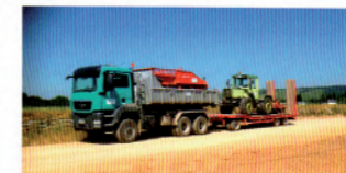
Gespann LKW mit Abrollcontainer und Tieflader