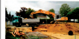
Aushub einer Baugrube

Durch eine individuelle Beratung vor Ort sind wir in der Lage, Ihre Aufträge präzise und zuverlässig auszuführen. Wir arbeiten regional mit einem modern ausgestatteten Maschinenpark, der es uns ermöglicht, flexibel auf Ihre speziellen Anforderungen einzugehen. Das alles macht uns seit über drei Jahrzehnten zum geeigneten Partner an Ihrer Seite.