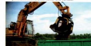
Sieblöffel im Einsatz

Wir wünschen Ihnen beim Neujahrskonzert gute Unterhaltung und für das neue Jahr alles Gute!