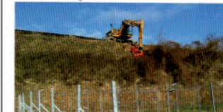
Büschungspflege in den Weinbergen