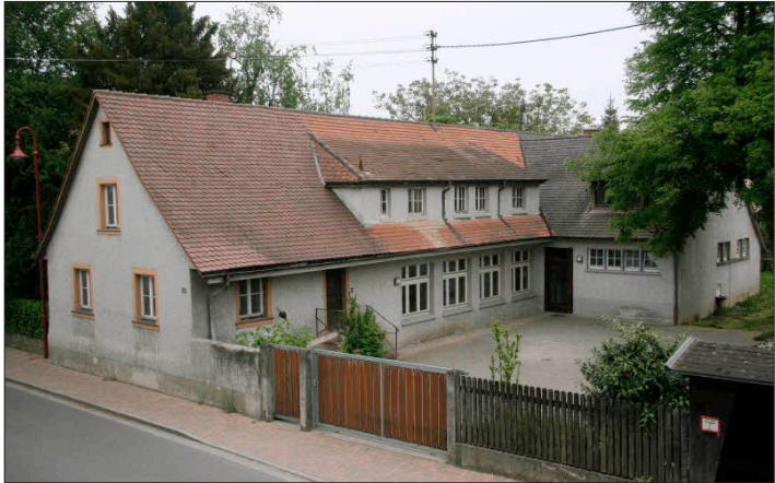
Ein Bild, das nun Vergangenheit ist: Mitte 2009 stand der „Alte Kindergarten“ noch.

Aus diesem Grund lädt das Gottenheimer Gemeindeteam in der