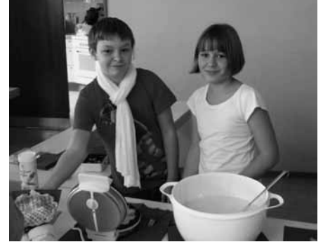
Eure BE-Gruppe Gottenheims Kinder