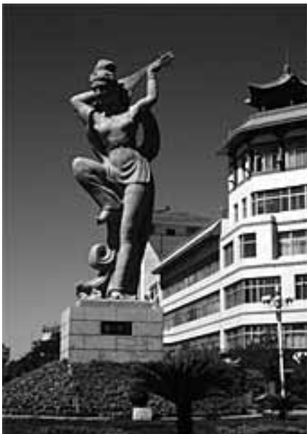
Absara, Wahrzeichen von Dunhuang/Gansu

Der Referent hat zwischen 1999 und heute mehrfach China bereist und gibt an diesem Abend Eindrücke und Informationen von seiner jüngsten Reise 2010 quer durch Chinas Norden. Zwei „rote Fäden“ sind die „Seidenstraße“ und die „Große Mauer“. Der Weg führt von Peking bis zum Westende in der Wüste, dem „Großen Durchlass unter dem Himmel“. Zu manchen Teilthemen werden auch die aktuellen Bilder solchen von vor 10 Jahren gegenübergestellt, wie überhaupt gezielt Kontraste aufgezeigt werden.