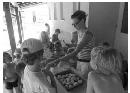
Sonne gut, Brötchen gut. Nach 40 Minuten im Solarofen ist der Teig gar - ganz ohne Strom!