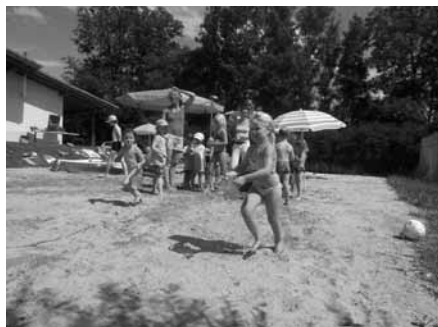
Zwei Gruppen kleiner Waldwichtel füllen im Wettlauf die Wassereimer.

Autoren: Celine Heitzler und Maximilian Hagemann