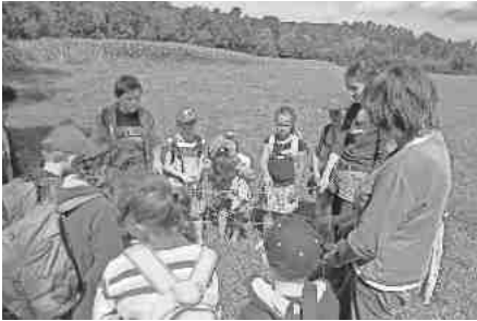
Zum Abschluss gab es das Spinnennetz

Aber schließlich wurde er doch gefunden: eine Tüte mit dicken Gummibären-Laubfröschen. Jeder bekam einen zur Stärkung. Zum Abschluss gab es ein „Öko-Netz“: die Kinder standen im Kreis und mit einer zum Knäuel aufgewickelten Schnur wurde diese kreuz und quer zwischen den Kindern hin- und hergespannt, bis eine Art Netz entstanden war, auf dem sogar zwei der Kinder (fast) liegen konnten. Etwas ermüdet marschierten dann alle wieder zur Bachbrücke. Danke, Frau Reduth!