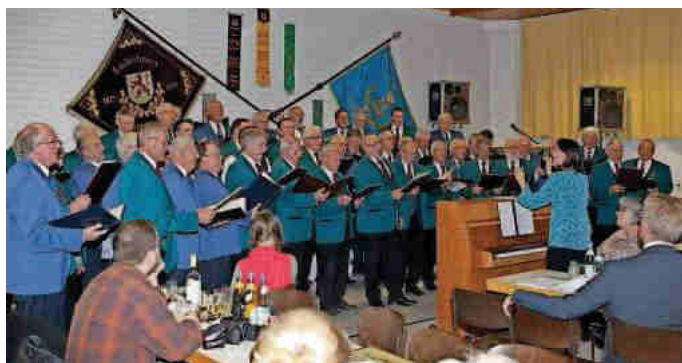
Gemeinsam singen im Verein: Der Männergesangverein Gottenheim und der Männergesangverein Neuershausen beim „Fliegermarsch“.