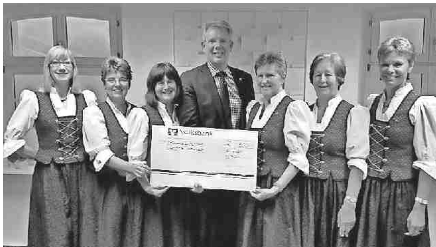
Auf der Generalversammlung der Landfrauen übergab das Vorstandsteam einen Spendenscheck über 1.500,- Euro für die Umgestaltung des Tunibergspielplatzes an Bürgermeister Christian Riesterer.

Eine besondere Überraschung hatte das Vorstandsteam für Bürgermeister Christian Riesterer an diesem Abend vorbereitet. Die Landfrauen übergaben dem Bürgermeister aus ihrem Vereinsvermögen einen Spendenscheck über 1.500 Euro für die Möblierung des Tunibergspielplatzes, der zu einem Mehrgenerationenplatz für Begegnungen von Alt und Jung umgestaltet wird. Bürgermeister Riesterer war freudig überrascht und dankte im Namen der Gemeinde und aller Bürger herzlich für die großzügige Spende.