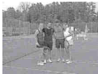
Die Mixedpaarung im Finale