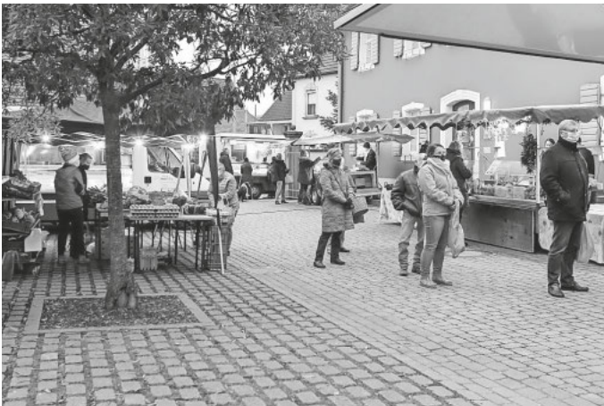
Der Wochenmarkt am Rathaus ist – auch in Zeiten von Corona – nach Ansicht der Bürgerinnen und Bürger ein Pluspunkt für Gottenheim.

Ein attraktiver Ortskern, mehr Einkaufsmöglichkeiten, weniger Autoverkehr, eine gute Radweganbindung, bezahlbare Wohnungen, mehr Angebote für Jugendliche und Senioren, ein lebendiges Vereinsleben und eine naturnahe Landschaft – so stellen sich die Gottenheimer die Zukunft der Gemeinde vor. Insgesamt 531 Bürgerinnen und Bürger haben diese und viele weitere Themen ins Spiel gebracht: Durch die Teilnahme an der Bürgerumfrage auf dem Weg zum Gemeindeentwicklungskonzept „Zukunft Gottenheim“.