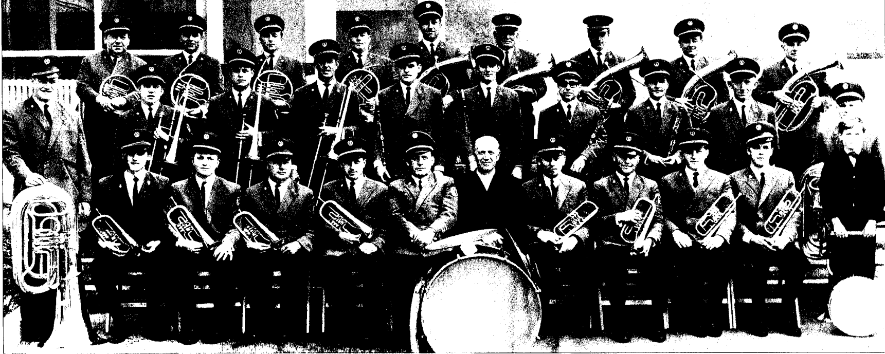
Der Musikverein Gottenheim kann auf eine lange Tradition verweisen, hier eine Aufnahme aus dem Jahr 1967. Einige Musiker von damals spielen beim Festbankett zum 125-jährigen Bestehen des Vereins in der „Traditionskapelle“ mit, die sich eigens zum Jubiläum zusammengefunden hat.