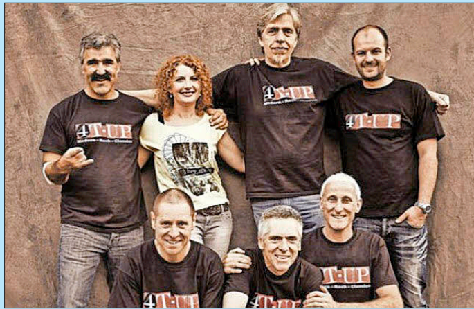
Die Band „4T-UP“ rockt am Samstag unter der Pergola.

Kraftvoll, frech, mitreißend oder „einfach genial“ lauten die Schlagworte, die man zu hören bekommt, wenn man nach einem Konzert der Band das Publikum befragt. Mit viel Freude und reichlich Spaß an der Musik rockt 4T-UP schon seit mehr als zehn Jahren mit einem einzigartigen Musikrepertoire die Region. Auch in der Sportgaststätte „Schwarz-Weiß“ waren die Musiker und ihre Sängerin schon zu Gast. Nach Gottenheim bringen sie Kracher von Deep Pur-