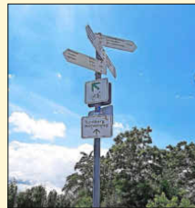
Der Tuniberg-Höhenweg lädt zum Genießen ein.

Um den Ausflüglern und Gästen aus nah und fern die Sommerferien zu versüßen, hat sich der Verein „Tuniberg Wein“ nun wieder eine besondere Aktion ausgedacht. Da-